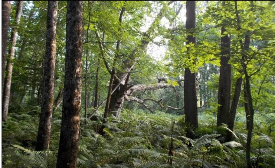
Vieille frênaie, dans le milieu riverain de la rivière du Chêne