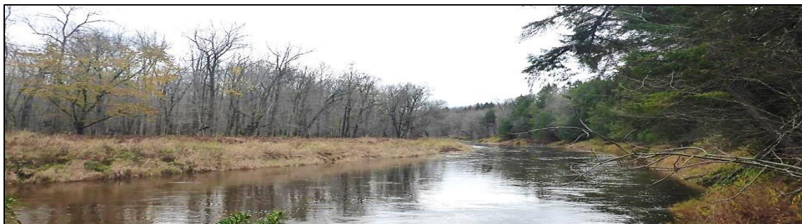
Terrasse alluviale et vieille forêt, Joly

On possédait déjà des données sur 2,9 km 2 de vieux peuplements situés dans le corridor riverain de ces rivières. Le présent inventaire a permis de caractériser 41 nouveaux vieux peuplements totalisant 1,7 km 2 ha situés dans le même corridor. Le secteur inventorié couvre 8,5 km linéaires de corridors riverains. Il est composé de grandes terrasses alluviales et de berges escarpées. Les talus, très érodables, ont des pentes de plus de 40%. On y retrouve une trentaine de ruisseaux intermittents coulant dans de profonds ravins.